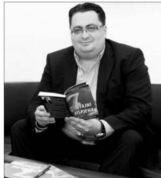
Sabrao sedam tajni - praktičnih savjeta

emisiju koja se zove „Zmajevno gnijezdo“, gdje sjedi pet uspješnih privrednika, a ljudi dolaze s idejama za biznis. Oni onda ulazu novac u najbolje ideje i prate njihov razvoj. Ne kažem da ne trebaju